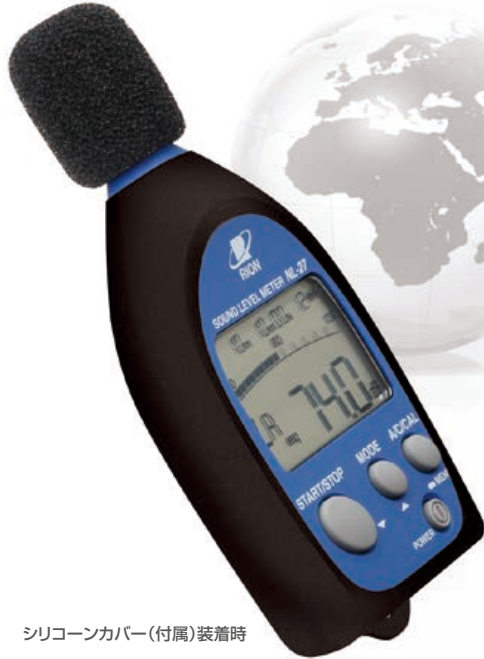
シリコンカバー(付属)装着時